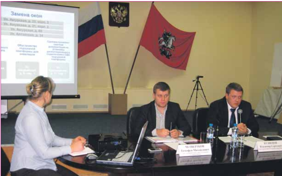
Начало на стр. 1.

Деятельность подрядчиков строго контролировалась управой района, депутатским корпусом и администрацией учебных заведений, что позволило своевременно выявить недостатки. Так, при строительстве спортивной площадки на территории школы № 1475, подрядчик был