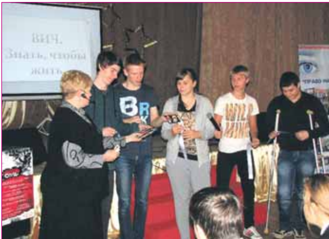
Информационный урок в ГБОУ СОШ №1688 состоялся 24 октября.

Обсуждались в ходе урока и вопросы усыновления детей, имеющих ВИЧ-инфекцию, как проявления социальной ответственности общества и конкретных людей. Говорилось о соблюдении простых правил повседневной жизни, чтобы не стать инфицированным. Прежде всего, надо любить себя и